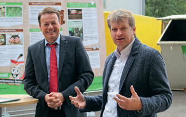
Landrat Günther-Martin Pauli mit Regierungspräsident Klaus Tappeser auf der Kreismülldeponie in Hechingen